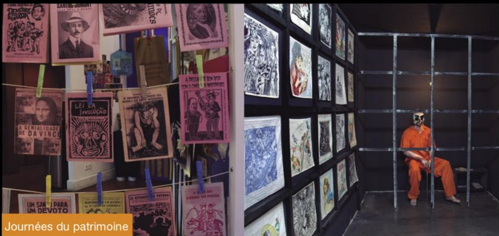
Journées du patrimoine