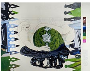
Specimen from Local Ephemera: Go Go Green Compression with Black Ooze , 2008

Drab Hanger, 2007 Pinpoint Black, 2007 Graphite, acrylique et vernis à ongles sur papier