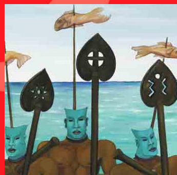
Edouard Duval-Carrié, détail