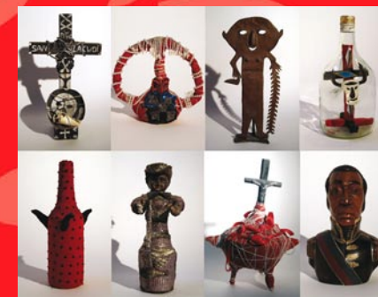
Collection Edouard Duval-Carrié