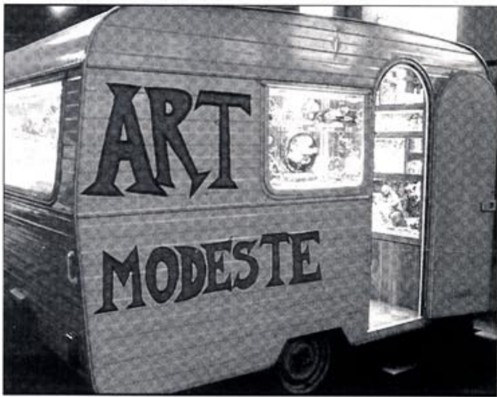
La caravane de "l'Art Modeste".

Créée en 1991 par Hervé Di Rosa et Bernard Belluc, l'Association de l'art modeste avec sa volonté de réunir comme un patrimoine des objets quotidiens, préfigurait le musée actuel : le Musée international d'art modeste. Son inauguration est prévue pour le mois de Novembre.