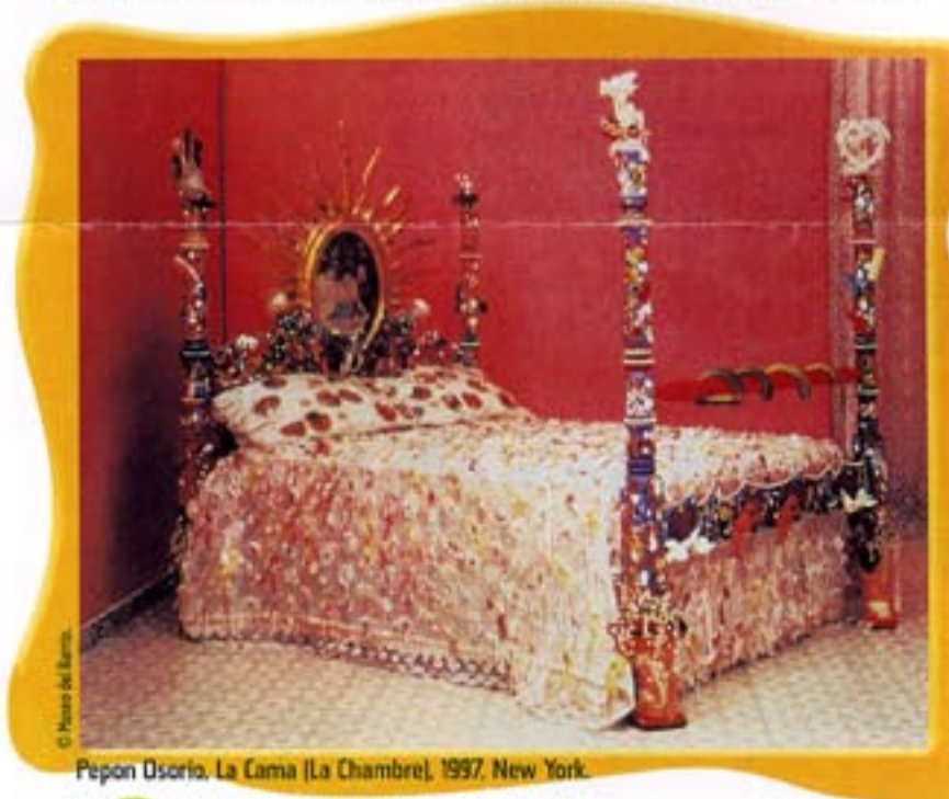
Pepón Osorio, La Cama (La Chambre), 1997, New York.