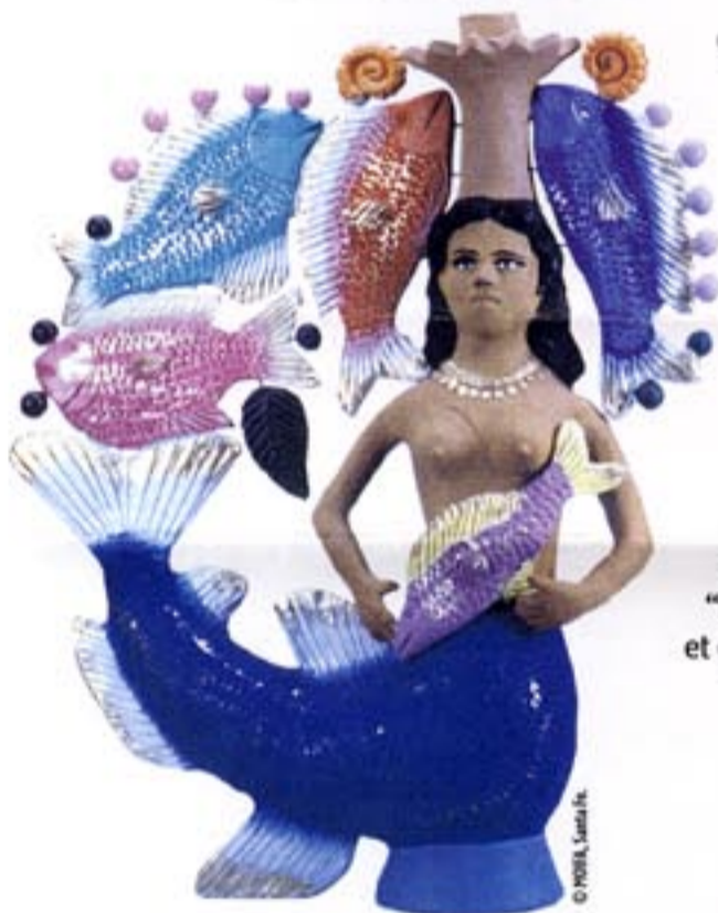
Irene Aguilar, Siren (Sirène), 1994, terre cuite polychrome.

Les sirènes sont des "monstres" marins imaginaires, alliant une tête et un buste de femme à une queue de poisson. Elles symbolisent la séduction, mais se montrent dangereuses pour les navigateurs au point qu'Ulysse dans son odyssee se fit attacher au mât de son bateau.