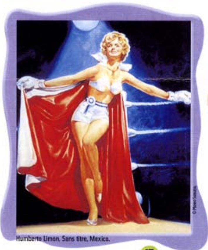
Humberto Limón, Sans titre, Mexico.

Pour cette peinture aux couleurs criardes, l'artiste a adopté le style des affiches de cinéma. La femme, vue par en bas, au niveau de l'estrade, a l'air d'une star. Elle voudrait ressembler à Marilyn Monroe (cf. Julie n° 32, mars 2001), avec son rouge à lèvres écarlate et son sourire dentifrice, mais semble sortie d'un défilé de majorettes. La placer sur un ring en l'équipant de gants de boxe, voilà qui est inattendu !