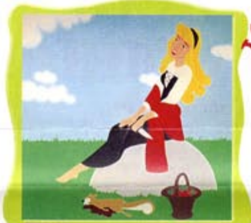
Marina Bolmini, Primavera (Printemps), 1995, acrylique sur toile, Italie.