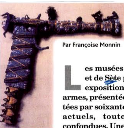
Par Françoise Monnin

L es musées de St-Étienne et de Sète présentent une exposition consacrée aux armes, présentées ou représentées par soixante-deux artistes actuels, toutes tendances confondues. Une idée explosive de l'artiste Hervé Di Rosa !